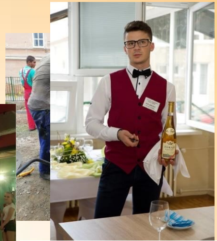
Záróvizsga gyakorlati része