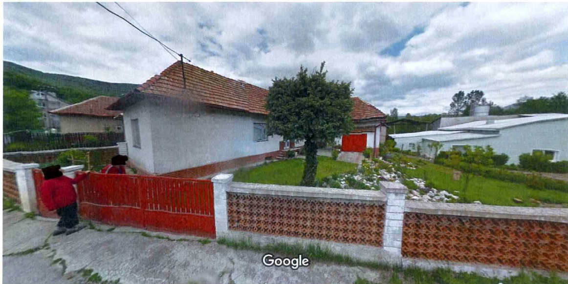
Vytvorenie snímky: máj 2012