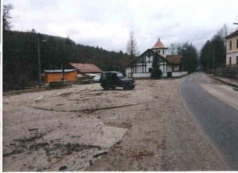
Pozemok KN C parc.č.2913/4, k.ú. Rožňava, fotodokumentácia zo dňa 14.10.2017 a 12.01.2018