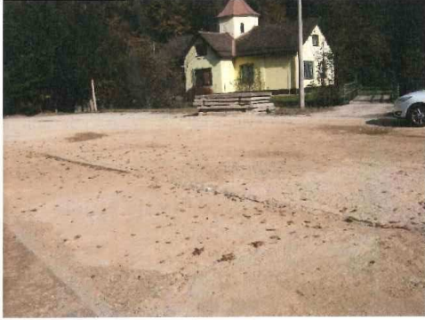
Pozemok KN C parc.č.2924/10, k.ú. Rožňava s parkoviskom, fotodokumentácia zo dňa 14.10.2017 a 12.01.2018